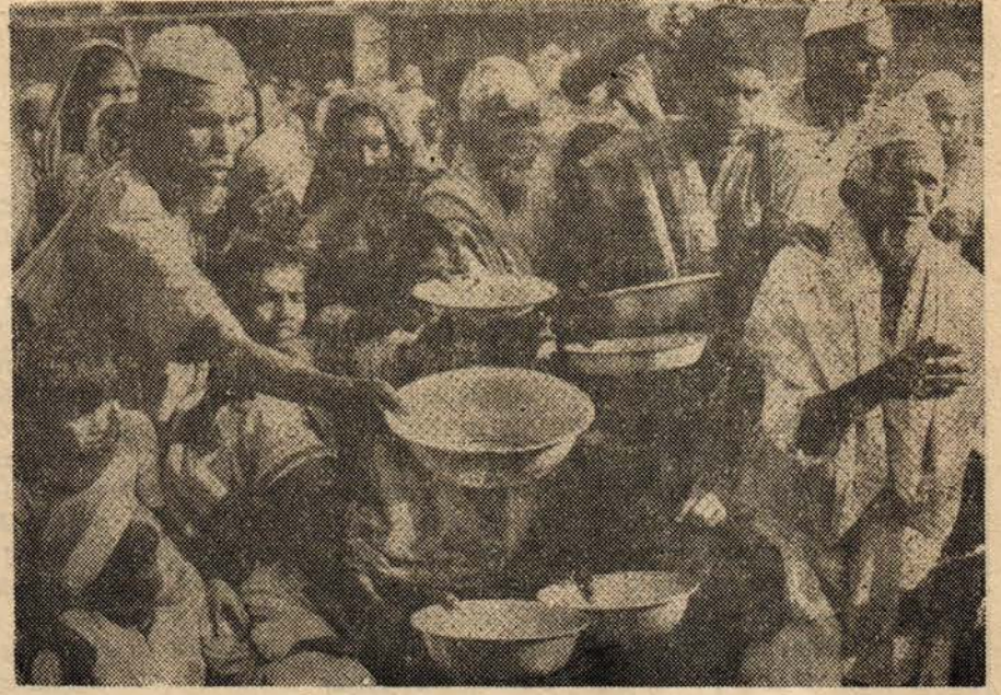
Açlığın tehdit ettiği Bengaldeş halkı.

Önceleri sola karşı hoşgörülü davranan ve sosyalist ülkelerden de destek alan Muciburrahman bir seri de radikal reformlar yapma yoluna gitmiş, 1972'de bankaları ve bazı sanayi kesimlerini millileştirmişti. Ancak ülke gerçekten de doğanın çok şanssız bir parçasında bulunuyordu. Ülkenin alt yapı tesisleri ne zaman bastıracağı hiç de kestirilemeyen seller ve korkunç muson yağmurları tarafından silip süpürülebiliyordu. Siklonlar, seller ve musonların her yıl milyonlarca kişinin ölümlerine yol açmasına rağmen nüfustaki korkunç artış Bengaldeş halkının devamlı olarak açlık içinde olmasına sebep oluyordu. Bir yıl görülen tarımsal